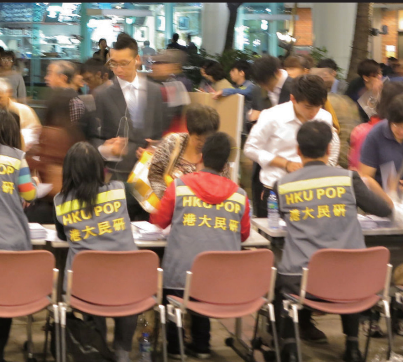
| 相片來源：Melanie Li 攝 |