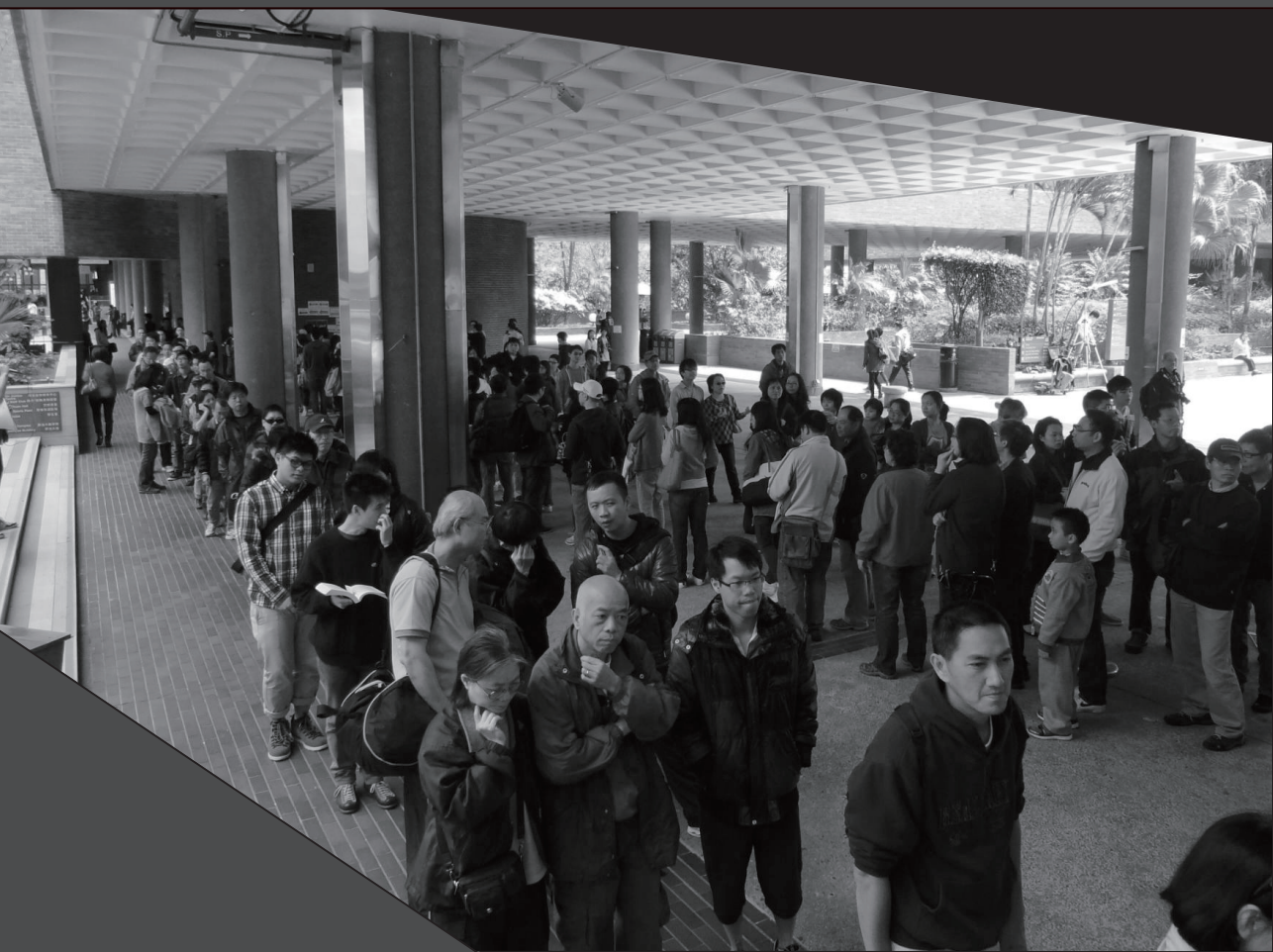
| 相片來源：余俊傑 攝 |